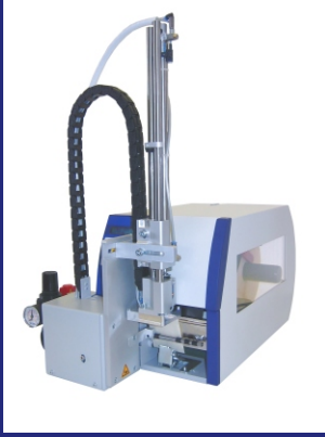
DER APPLIKATOR APL 100 FÜR ALLE DRUCKER DER COMPA-SERIE

Der Applikator APL 100 ist mit den Druckern der Compa Serie die preiswerte Lösung sowohl für den halbautomatischen Betrieb als auch für den Einbau in Produktionslinien.