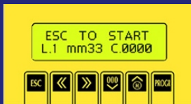
EINFACHE BEDIENUNG DURCH TOUCH PANEL

DIE ETIKETTENABSTABUNG IST DURCH EINE LICHT- SCHRANKE AUCH FÜR TRANSPARENT ETIKETTEN SO PLAZIERT, DASS DAS ZU ENTNEHMENDE ETIKETT IMMER OPTIMAL AN DER SPENDE- KANTE BEREITSTEHT.