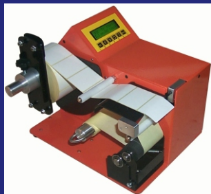
OPTIONAL: SICHERE FUNKTION DURCH SEPARATE FRIKTION