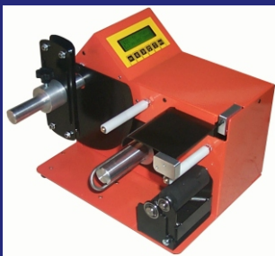
VENETUS DER ELEKTRISCHE ETIKETTENSPENDER FÜR JEDEN EINSATZ