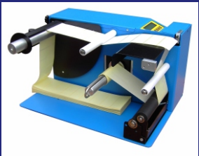
OPTIONAL: ZUSATZ ZUR VERARBEITUNG VON LEPORELLO-ETIKETTEN