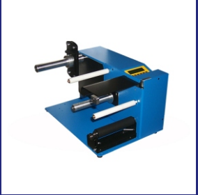
DIE ETIKETTENABTASTUNG IST DURCH EINE LICHT- SCHRANKE AUCH FÜR TRANSPARENT ETIKETTEN SO PLAZIERT, DASS DAS ZU ENTNEHMENDE ETIKETT IMMER OPTIMAL AN DER SPENDE- KANTE BEREITSTEHT.