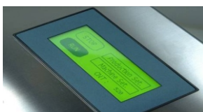
Digitales Display mit Touch-Screen