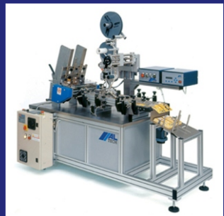
OBEN-ETIKETTIERUNG MIT ETIKETTIERMASCHINE AL RITMA