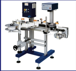
AL BELT FÜR RUNDUM-ETIKETTIERUNG, MIT ETIKETTIERMASCHINE AL STEP