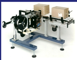
SEITLICHE ETIKETTIERUNG MIT ETIKETTIERMASCHINE AL CODE