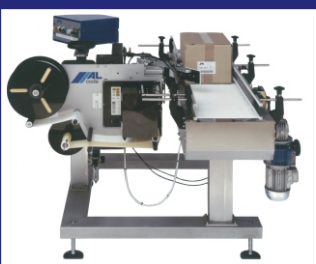
STIRNSEITEN-ETIKETTIERUNG MIT ETIKETTIERMASCHINE AL CODE