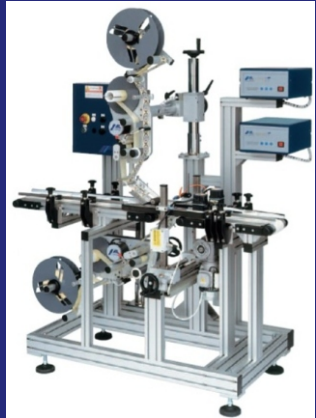
AL BELT FÜR OBEN- U. UNTEN-ETIKETTIERUNG, MIT ZWEI ETIKETTIER- MASCHINEN AL STEP